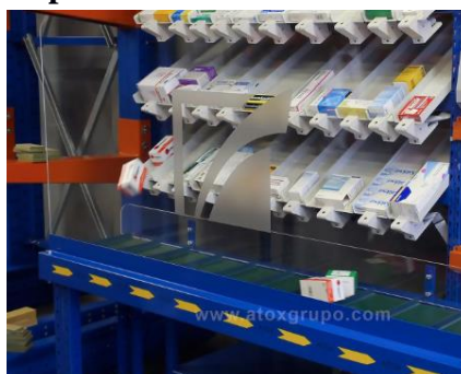
Dispensador de medicamentos

El dispensador los podemos representar como una matriz bidimensional de 20 x 15 en donde cada columna se corresponde con un medicamento (omeprazol, ibuprofeno, etc.) y el número de filas se corresponde con el número máximo de medicamentos de cada tipo.